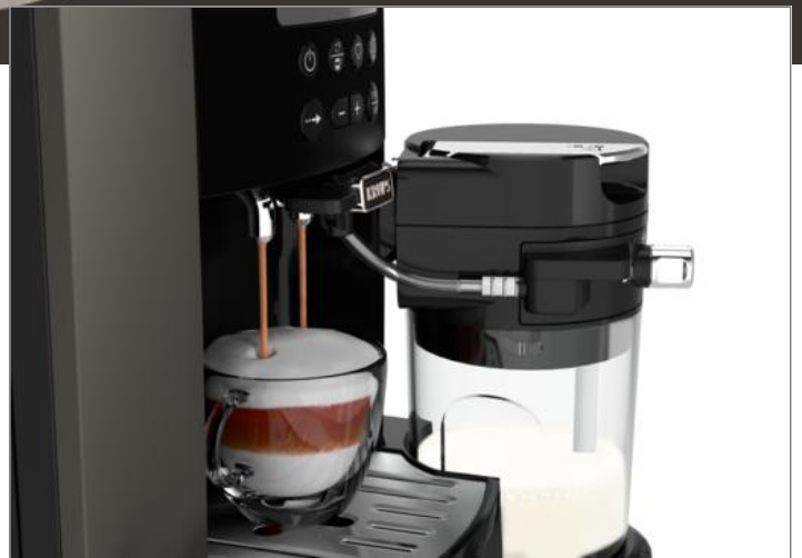
ARABICA LATTE EA819 ESP ARABICA LATTE KUPFER EA819ECH